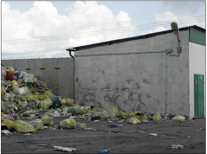
WIDOK ŚCIANY B - C